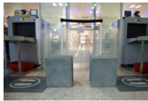
Des tapis détecteurs de métaux pour gagner du temps aux contrôles - Genève Aéroport

Ne pas avoir de liquide dans son sac, ni de pièce de monnaie dans ses poches, sortir les appareils électroniques du sac cabine... les voyageurs d'affaires connaissent tous les trucs pour passer les check-points rapidement. Une routine bien huilée qui peut dérailler à cause d'une paire de chaussures ! Pour éviter que les passagers effectuent un second passage déchaussé au portique, Genève Aéroport et l'entreprise Sedect ont développé un tapis détecteur de métaux qui indique si un voyageur doit se déchausser ou non avant son passage.